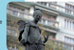
Déesse de Just Becquet.

La statue de Déesse (1884) de Just Becquet sera mise à l'abri pendant la durée des travaux. Elle retrouvera son emplacement et dominera à nouveau la place une fois les rails du tramway posés.