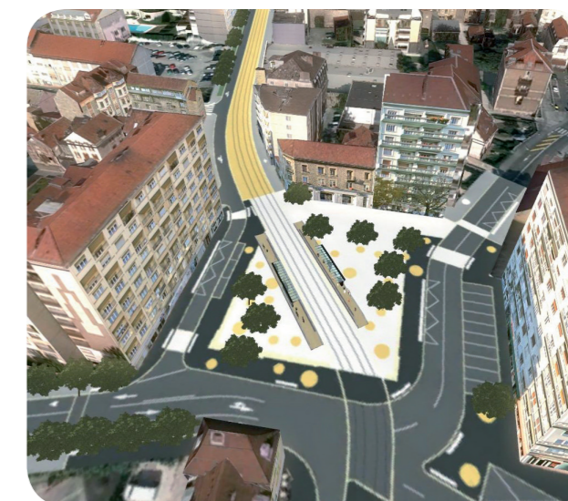
Projection 3 D du Projet tramway Place Flore à l'horizon 2014.

Des médiateurs de travaux et de commerces sont également à votre disposition pour répondre à vos questions et trouver avec vous les solutions aux éventuelles difficultés que vous pourriez rencontrer pendant cette période.