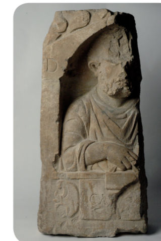
Stèle funéraire gallo-romaine découverte au XIX e siècle dans le secteur de la gare Viotte.