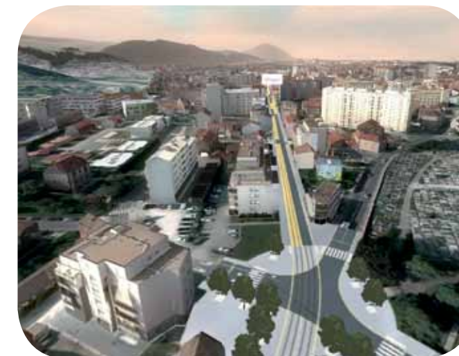
Projection 3D du projet Tramway Avenue Fontaine Argent à l'horizon 2014

Des médiateurs de travaux et de commerces sont également à votre disposition pour répondre à vos questions et trouver avec vous les solutions aux éventuels problèmes que vous pourriez rencontrer pendant cette période.