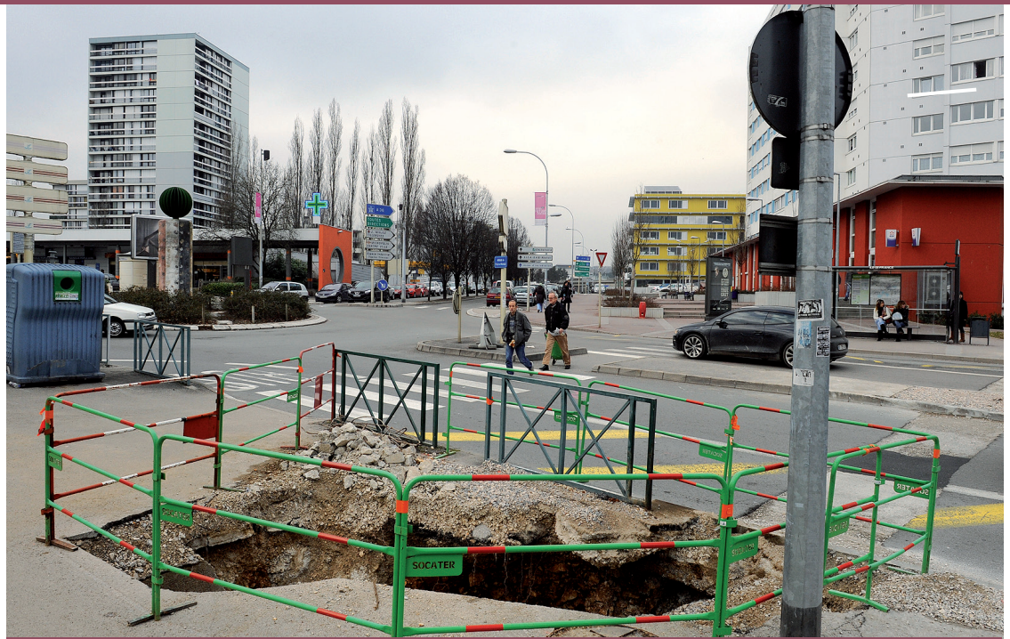
Les travaux de dévoiement des réseaux gaz, électricité, eau... ont maintenant démarré dans la plupart des quartiers concernés par l'arrivée du tramway (ici avenue Île-de-France avec le réseau du gaz).