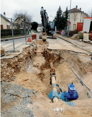
Travaux sur le réseau d'eau, rue des Pâquerettes.